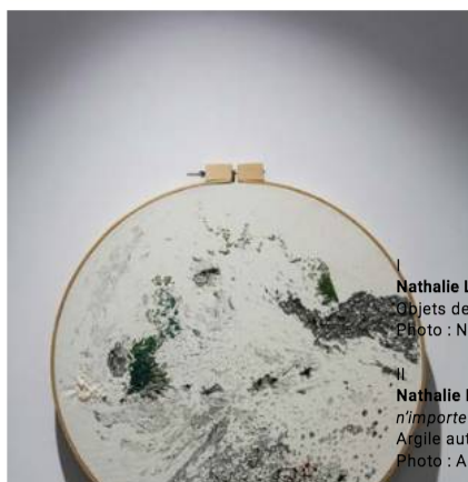
Nathalie Lavoie , Intégrer et imiter des objets de la nature (2019) Objets de la nature et modelages en argile