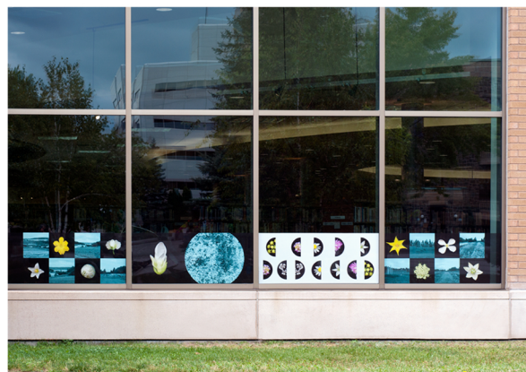
À travers ses œuvres, Nathalie Lavoie veut créer de l'émerveillement et laisser place à l'imaginaire du visiteur.