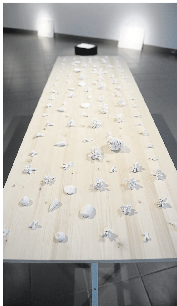
L'artiste reproduit avec l'argile blanche des cônes de pin.

numériques sur papier. Les cônes ramassés ont été moulés puis transformés en petites oeuvres d'argile.